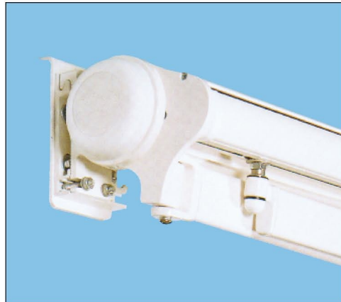
Ansicht der geschlossenen Markise

Diese Neue Markisengeneration kann auf speziell gestalteten Konsolen montiert werden, die eine schnelle und einfache Montage garantiert. Alle Eigenschaften sind bis ins kleinste Detail durchdacht worden, um diesem Markisenmodell ein klares und einfaches Design zu geben, das die neue Produktlinie kennzeichnet.