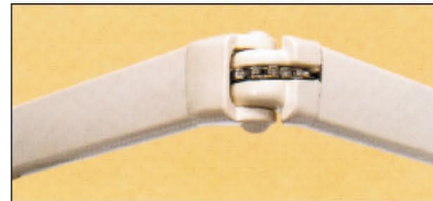
Gelenkarm mit Kette (8000 Bedienzyklen getestet)

Diese mit dazwischen positionierten Edelstahlketten-gelenkarmen ausgerüstete Markise verfügt über eine stranggepreßte Schutzhülse, die direkt auf die dafür vorgesehenen Universalseitenkonsolen montiert wird.